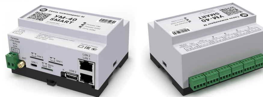
Рисунок 5. Внешний вид устройства