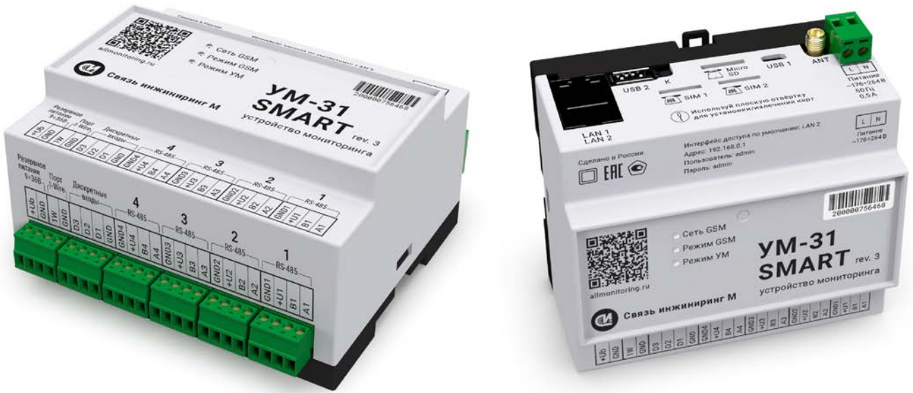
Рисунок 1 – Внешний вид УМ

На корпусе УМ расположены клеммники, индикаторы и кнопки, расположение которых приведено на рисунке 2.