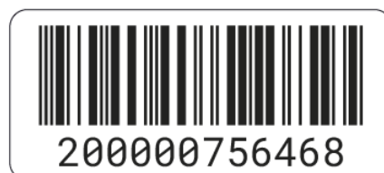
Рисунок 4. Формат наклейки с серийным номером

На наклейке указан серийный номер устройства и его представление в виде штрих-кода.