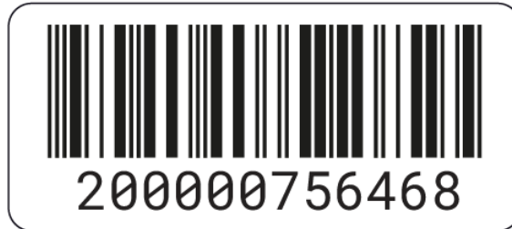
Рисунок 3. Формат наклейки

На наклейке указана следующая информация: