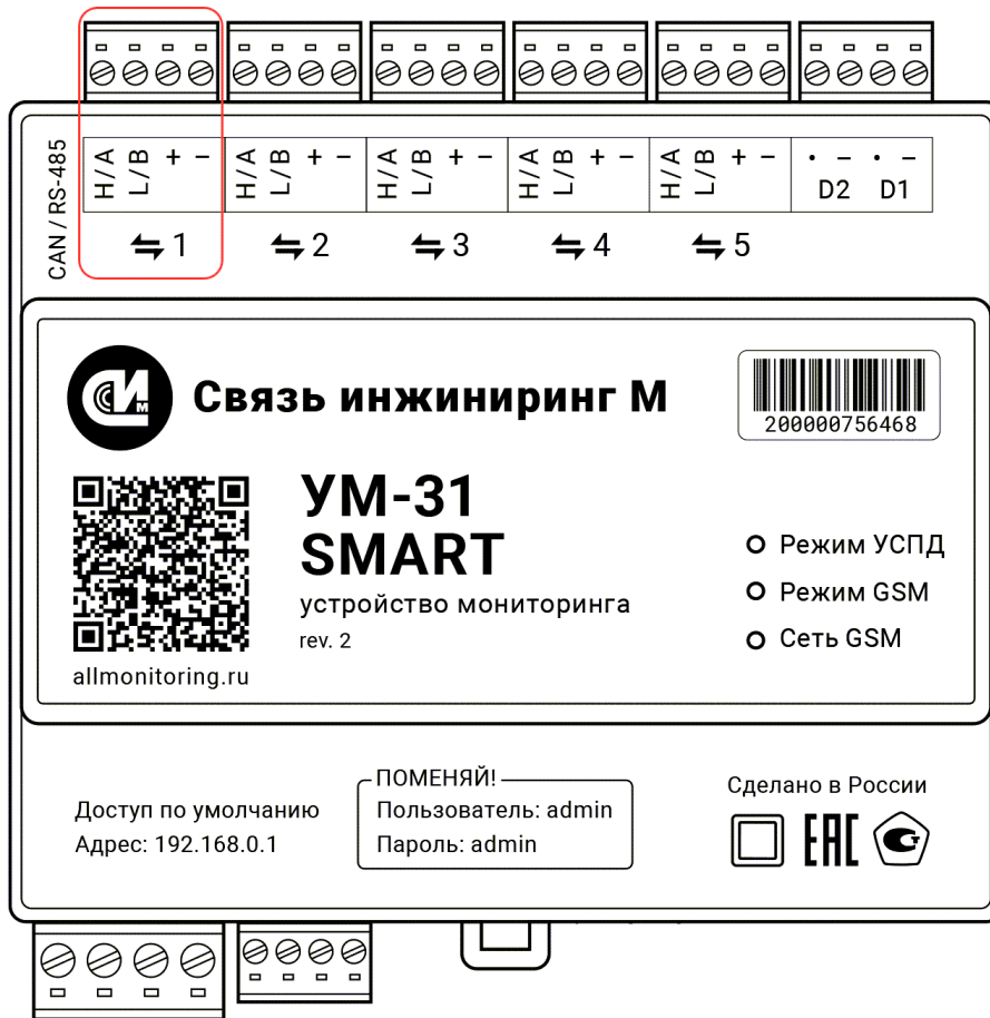
Рисунок 5. Внешний вид устройства