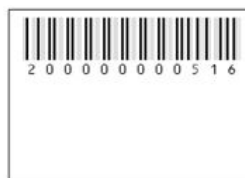
Рисунок 4. Формат наклейки с серийным номером

На наклейке указан серийный номер устройства и его представление в виде штрих-кода.