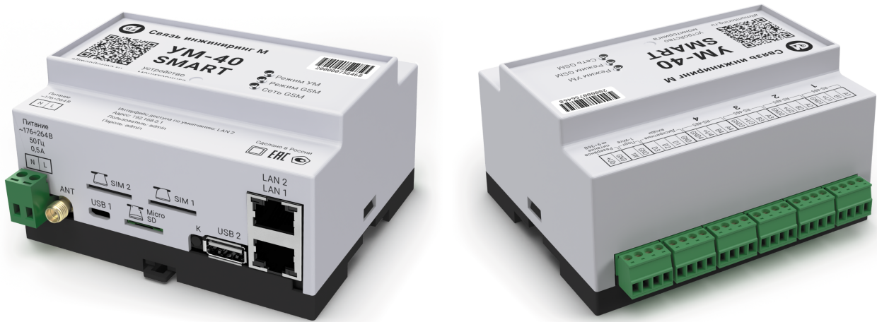
Рисунок 5. Внешний вид устройства