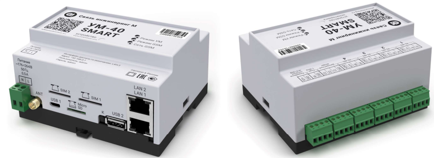
Рисунок 5. Внешний вид устройства